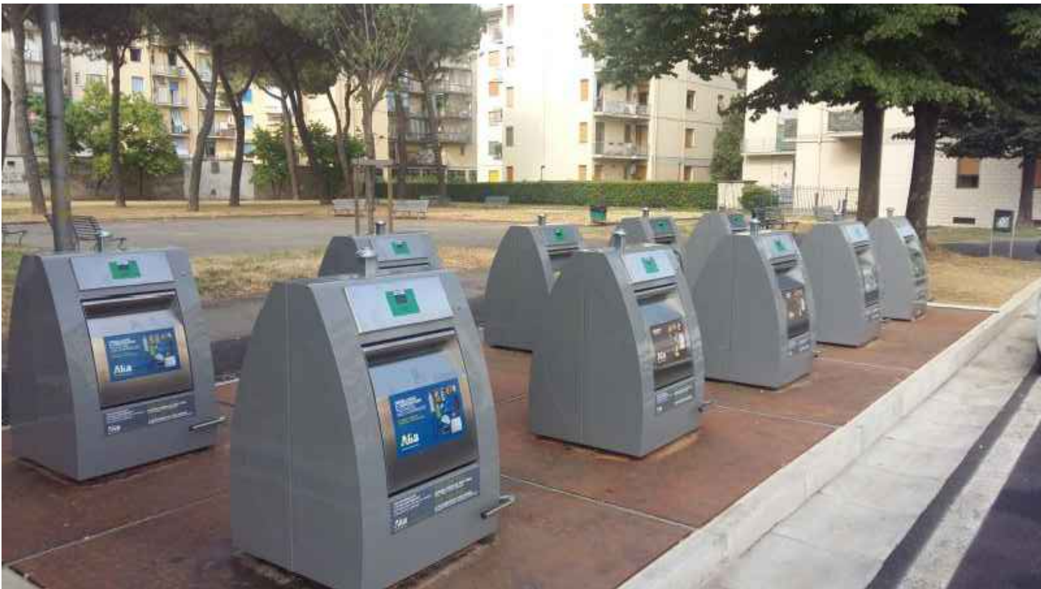
TIPOLOGICO ISOLA ECOLOGICA (con contenitori interrati e accoppiati)