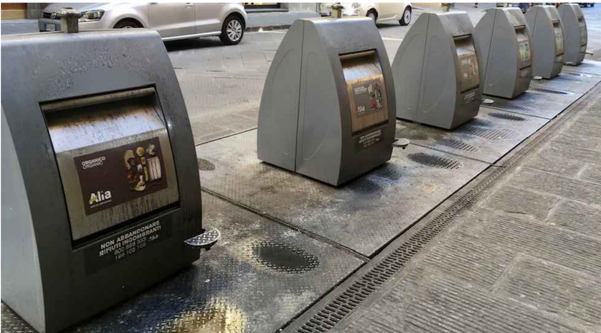
TIPOLOGICO ISOLA ECOLOGICA (con contenitori allineati)